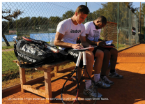
Les nouveaux T-Fight Dynacore. Ici les Pickers de l'ATP et là les coachs de la Tour.

En vente depuis le 1 er février, la nouvelle gamme signée Tecnifibre est le fruit d'un long processus d'échanges et de tests menés par la marque française auprès de coachs, de cordeurs, de joueurs et de l'ATP.