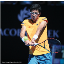
Hyeon Chung à l'Open d'Australie (2014)

Dans quels domaines peux-tu progresser ? Un point, j'ai imaginé mes résultats d'expérience et constaté qu'il y avait de la place pour progresser. Je travaille donc sur tous les aspects du jeu : physique, mental, technique et tactique.