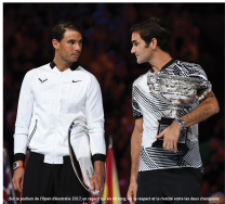
Sur le podium de l'Open d'Australie (09), un regard sur un long... le respect et la rivalité entre les deux champions

Si Federer, alors n°1 mondial, part plutôt favori face à un Nadal qui dispute son 1 er Roland-Garros, le Suisse finit par s'incliner. Malgré un setback dans le 2 e set, le jeu de défense de Nadal comme sa régularité lui offrent la victoire. « Je n'ai eu pas que Rafa à son côté, c'est très grand match, souligne Federer. Et, en revanche, je possédais les clés pour gagner cette partie, mais j'ai perdu à mon tour. Lui a été beaucoup plus régulier, plus constant, il n'a pas eu de balles de régime. Moi j'ai mal commencé et j'ai mal fini.