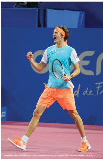
Alexander Zverev, lors du tournoi ATP de Montpellier (2017), qui a remporté face à Richard Gasquet (7-6, 6-1).

nouveau statut. Ce qui passe par quelques contre-performances : défaite au 1 er tour à Monte-Carlo devant Nicolas Pietrangeli ou au 1 er tour à Barcelone devant le Coréen Hyeon Chung à Monte-Carlo, Zverev n'a jamais trouvé la solution devant le lift de Nadal (6/1, 6/1). Sur apprentissage : « Sur terre battue, à part cette défaite contre Rafa, je fais de bons matchs avec mes amis. Je dois d'enchainer les victoires pour être prêt à défier les tous meilleurs », estime Zverev.