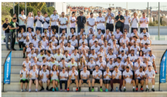
Les ambassadeurs de la Aegon Open 2017