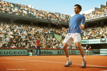
Photo Top Spin 4

le bon timing pour déclencher la frappe etc. L'occasion de développer son « toucher » et d'apprendre ou réapprendre vos fondamentaux tactiques. Les puristes regretteront cependant des joueurs lourds et une ambiance graphique et sonore encore perfectible.