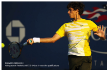
PIRE FLUOR OPEN 2012 Maison de l'Éducation Sportive de France (MSE) au 1 er tour des qualifications

ou soit, aussi solide que soit l'encadrement ou l'entraînement, c'est toujours le joueur, sa persévérance, son intelligence, ses facultés d'adaptation qui feront la différence.